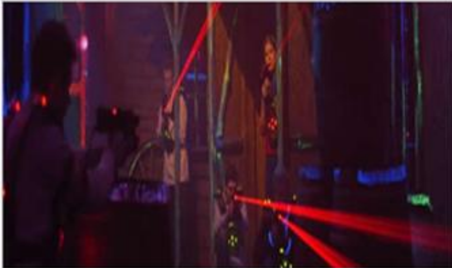
Abbildung 4.3: Der Ausrüstungsraum [las 2009]