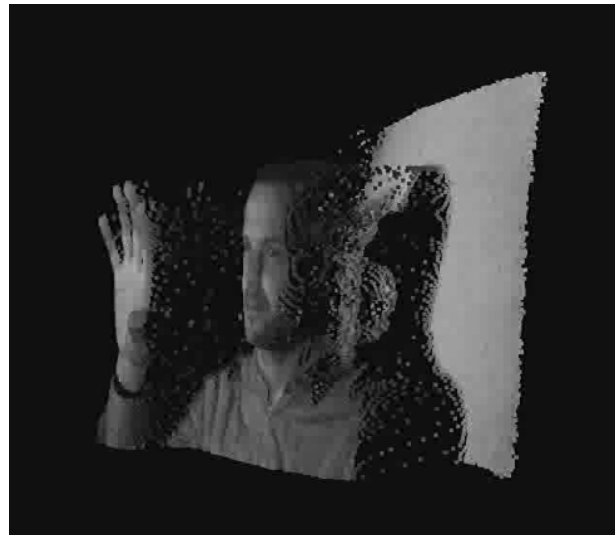
Abbildung 3: Tiefenbild einer Person

Sollte ein für die Aufnahme ein System verwendet werden, das direkt ein Tiefenbild der betrachteten Szene zur Verfügung stellt, muss in diesem Schritt außer einer eventuellen Vorverarbeitung für den nächsten Schritt nichts weiter getan werden.