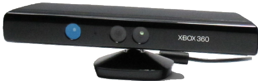
Abbildung 2: Ein Kinect-Sensor