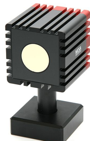
Abbildung 1: TOF-Kamera

Die Weiterverarbeitung der Daten wird vereinfacht, da die meisten Modelle dieser Kameras direkt Tiefenbilder der aufgenommenen Szene anbieten.